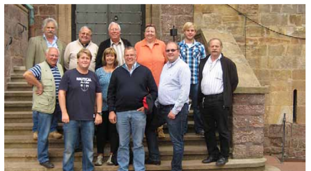
CDU Pfungstadt geht in Klausur Neben den inhaltlichen Diskussionen um die Fortschreibung des Flächennutzungsplans, der Neuordnung des Personennahverkehrs in Pfungstadt und der Zukunft der Eberstädter Straße besuchten die Kommunalpolitiker im Rahmen ihrer Klausurtagung auch die Wartburg in Eisenach.