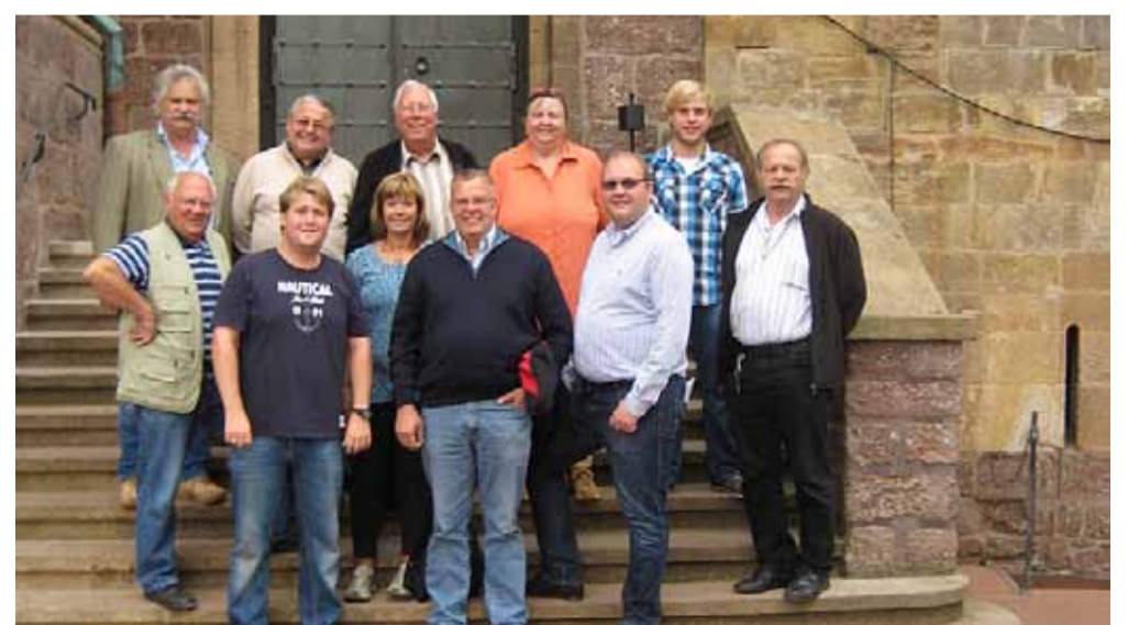
CDU Pfungstadt geht in Klausur Neben den inhaltlichen Diskussionen um die Fortschreibung des Flächennutzungsplans, der Neuordnung des Personennahverkehrs in Pfungstadt und der Zukunft der Eberstädter Straße besuchten die Kommunalpolitiker im Rahmen ihrer Klausurtagung auch die Wartburg in Eisenach.